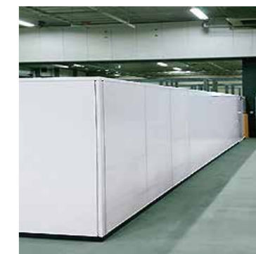
←補強柱取付側 ↑補強柱裏面 ▲スチールパーティション (FHS-50) 補強柱は片面のみの取付けなのでスッキリした納まりに仕上がります。