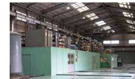
切妻屋根の建屋や天井クレーンが設置されている製造工場。