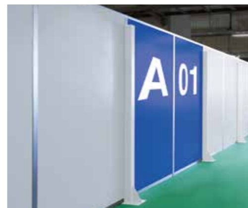
▲アルミパーティション (AHS, AHS-C) カラーパネルでエリア区分や管理区分を明確にできます。