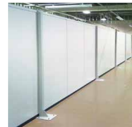
▲スチールパーティション (FHS-50) 補強柱はコンパクトサイズです。