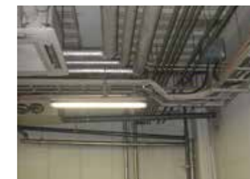
天井に配管やケーブルラックが張り巡らされている部屋。